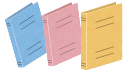
帳票類のチェックも行われます

実習生をいつも大切に指導して下さる受入施設様への感謝の気持ちと共に、今後も実習生のサポートに尽力してまいります。