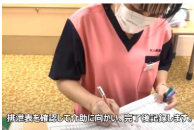
排泄表を確認して介助に向かい、完了後記録します。