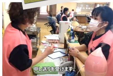
申し送りを受けます。